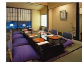
名古屋浅田 お座敷個室

お座敷に椅子をしつらえてのおもてなしもできるようになりました。 ご予約時にお気軽にお問い合わせくださいませ[30名様まで]