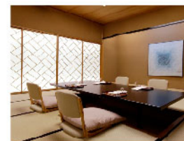
青山浅田 お座敷個室